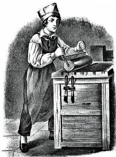
APRENDIZ DE IMPRENTA.