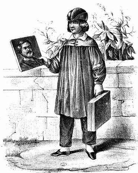
APRENDIZ DE PINTOR