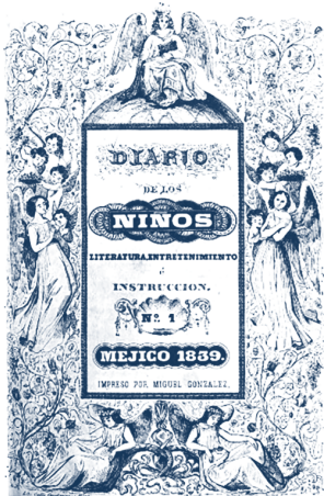
Figura 1. Primera portada del Diario de los Niños , 1839

Fuente: Diario de los niños. Literatura, entretenimiento e instrucción , vol. I, 1839, México, Imprenta de Miguel González, en: http://hndm.unam.mx