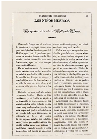
Figura 2. “Un episodio de la vida de Wolfgang [sic.] Mozart”, 1839

Fuente: Diario de los Niños I, Sección Los niños músicos, México, Imprenta de Miguel González, 1839, p. 65.