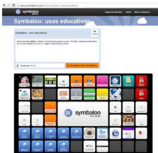
Figura 3. Recurso web que integra enlaces a fuentes de información