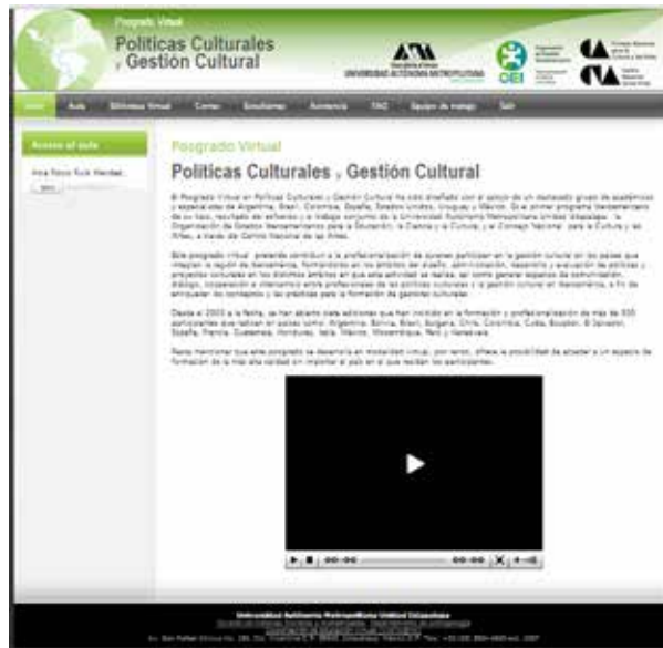
Figura 4. LMS de la UAM-I para la oferta en educación a distancia