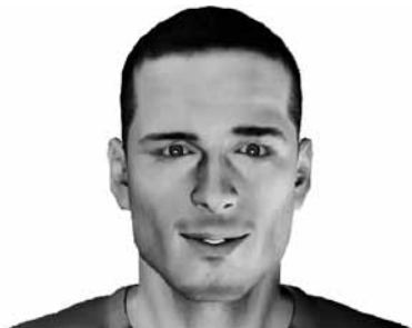
Figura 5. Interés